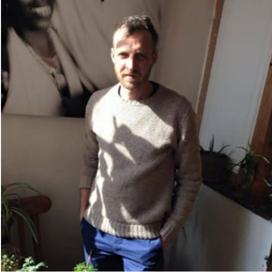
Stéphane Charpentier © Raphael Cottin